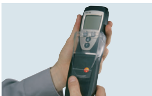
Optionale Schutzhülle TopSafe