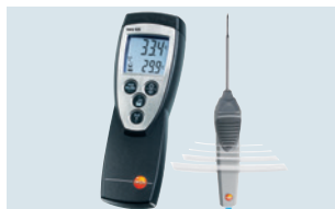
Kabellose Messung mit Funkfühler